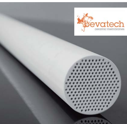
bevatech – Keramische Membran speziell für die Anwendung in der Getränkeindustrie

For the filtration of liquids in the beverages industry atech innovations gmbh has developed the product line "bevatech". In order to secure both the high product flow rates required in this type of application and best possible economic efficiency bevatech membranes have a particularly compact design.