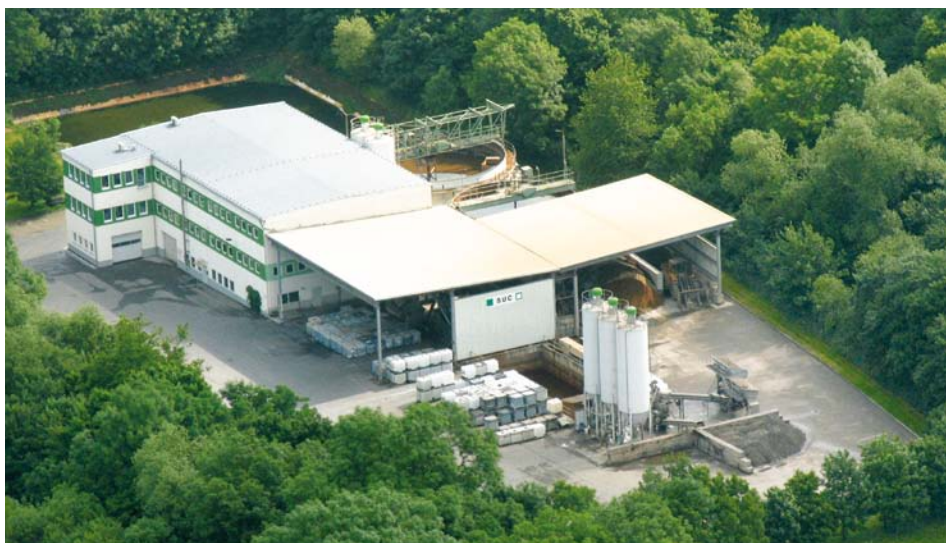
Luftaufnahme des Standortes Ohrdruf der SUC Entsorgung GmbH

Gesellschafter beschlossene Strategie bezüglich einer konsequenten Spartenstruktur im Falle der SUC Entsorgung GmbH umgesetzt. Dabei wurden drei Unternehmen mit ähnlichem Tätigkeitsbereich auf eines verschmolzen.