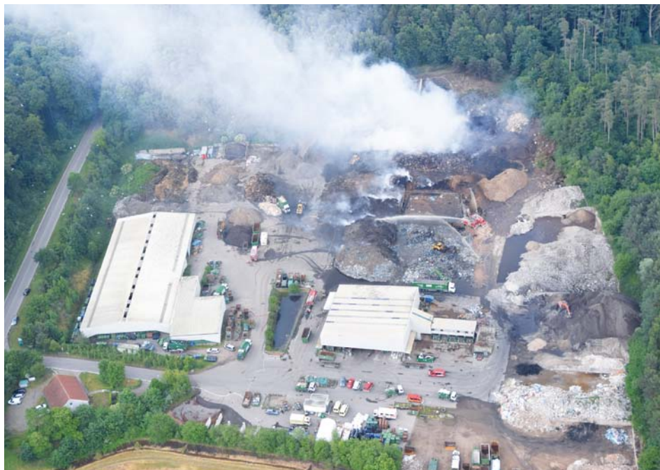
Großbrand im Recyclingpark Degtow

Bis dahin war es ein langer und kräftezehrender Weg. Um die 150 Personen kämpften gegen das drohende Übergreifen des Feuers auf den Nadelwald. Wegen der Qualmbildung musste die B 105, die direkt an dem Gelände vorbeiführt, zeitweise gesperrt werden. Zum Schutz der Bevölkerung in umliegenden Wohngebieten waren zwei Messfahrzeuge unterwegs, die ständig Untersuchungen der Luft auf giftige Stoffe durchführten. Die nachgewiesenen Schadstoffe waren allerdings in solch geringen Konzentrationen vorhanden, dass keine Gesundheitsgefährdung bestand.