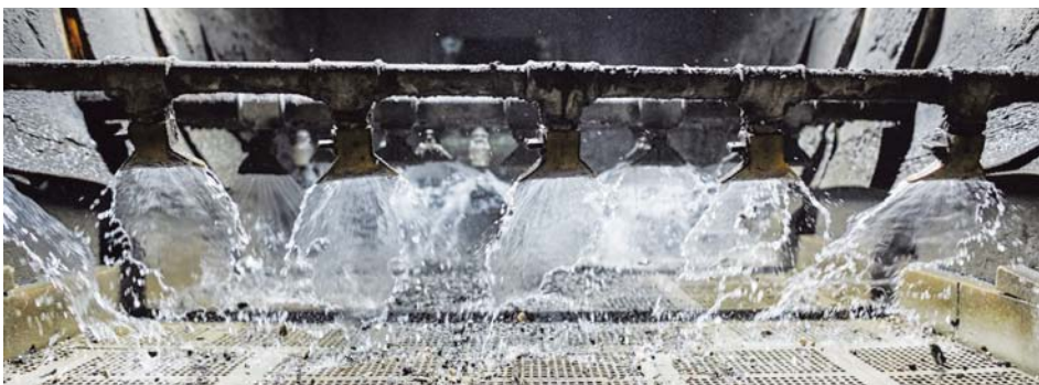
Bei der afu sind große Mengen Prozesswasser im Umlauf – hier beim 8-Millimeter-Sieb für das Überkorn.

Die neue Umkehrosmoseanlage wurde kürzlich durch eigene Fachkräfte in die bestehende Anlage integriert und steht vor der behördlichen Abnahme. Die Anlage wird bei einer Förderleistung von rund 10.000 l/h