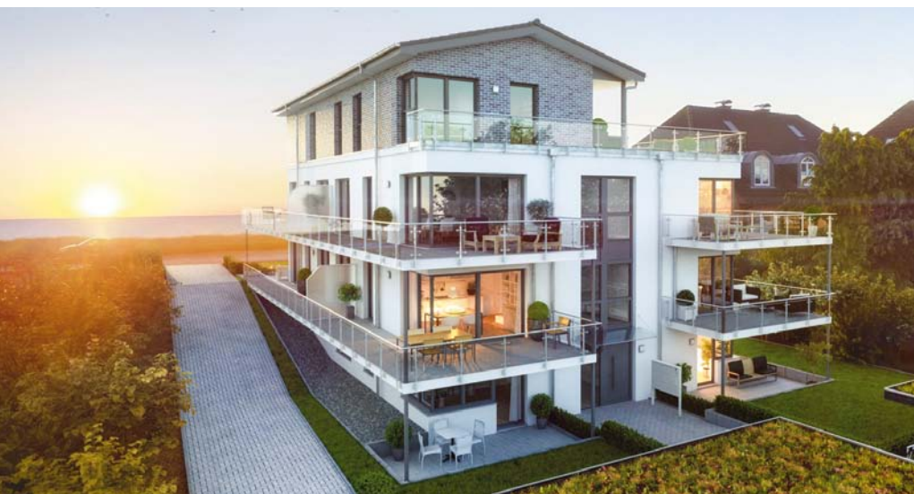
So wird das neue Objekt in der Strandallee 66 in Haffkrug aussehen.

"Construction" has always been a major issue within the ARAN group - after all, the group has developed from a small building supply firm. At first, own construction companies were operated but eventually the focus changed to project work. For more than 25 years now, Protech Seaside Projektentwicklungsgesellschaft mbH, founded in August 1990, has been a mainstay of the Real Estate Development division of the ARAN group.