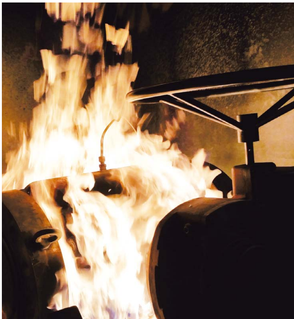
Firesafe-Test an einer Neukonstruktion der artec AIS

Due to dramatic changes in the European energy market power producing companies defer investments in the expansion of existing power generation fleets. This, in turn, has far-reaching consequences for the target markets of artec Armaturen und Industrieservice GmbH. This is why artec is strengthening its global distribution and is currently especially looking to Asian markets.