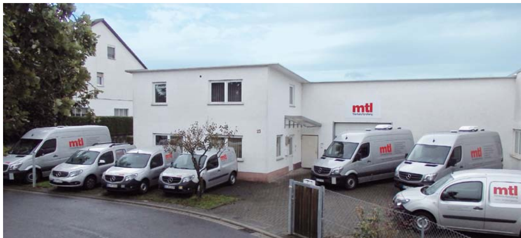
Neuer Standort der mtl in Großostheim

Außerdem wurde am zweiten Standort für die Kunden in Süddeutschland – in Frankfurt im Chemiepark Griesheim – eine 200 m 2 große Halle gemietet, so dass die mtl-Kunden in den Chemie-parks Höchst und Griesheim direkt vor Ort bedient werden können.